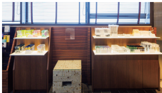
自由に選べる アメニティ

館内5階にはライブラリー・展示品・コーヒーサービスを兼ね備えたゲストラウンジがございます。滞在中の気分転換に最適な空間で、ごゆっくりお過ごしください。