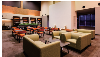
宿泊者専用 ゲストラウンジ

館内5階にはライブラリー・展示品・コーヒーサービスを兼ね備えたゲストラウンジがございます。滞在中の気分転換に最適な空間で、ごゆっくりお過ごしください。