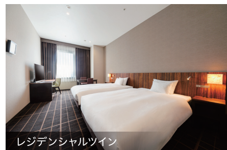
レジデンシャルツイン