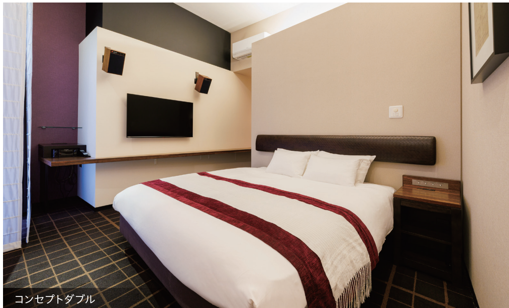
コンセプトダブル

非日常で過ごす、くつろぎの空間 地域の特徴を大胆に取り込んだ斬新なデザインと機能性が調和した客室