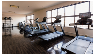
トレインビューの楽しめる フィットネスルーム

フロントロビーでお好きなアメニティをお持ちいただけるサービス「アメニティステーション」を設置。スキンケア用品、豊富な入浴剤、カミソリ、ヘアブラシなどをご用意しています。