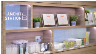
自由に選べる アメニティ