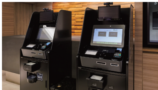
リモート接客サービス

JR浦和駅は4路線が乗り入れており、東京へも乗り換えなしで約30分。イベント会場や鉄道博物館へもアクセス良好です。駅周辺には大型商業施設や商店街があり、買い物や外食に便利な立地です。