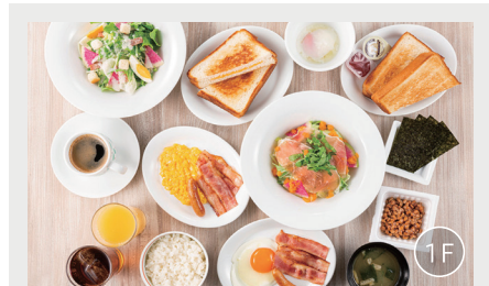
朝食会場「デニーズ」