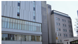
ビジネス・レジャーの 拠点