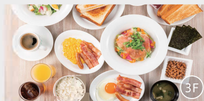
朝食会場「デニース」