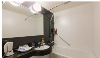
足を伸ばせる バスタブ

フロントロビーでお好きなアメニティをお持ちいただけるサービス「アメニティステーション」を設置。スキンケア用品、豊富な入浴剤、カミソリ、ヘアブラシなどをご用意しています。