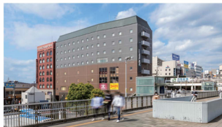
ビジネス・レジャーの 拠点

JR津田沼駅に乗り入れる総武線は東京駅や千葉駅だけでなく、舞浜リゾートエリアを有する舞浜駅へもアクセス良好。ビジネス・レジャーの拠点として大変便利な立地です。