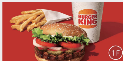
朝食会場「バーガーキング」

メインメニュー5種+ドリンクバーの組み合わせたプレートをお召し上がりいただけます。