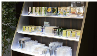
自由に選べる アメニティ

JR津田沼駅に乗り入れる総武線は東京駅や千葉駅だけでなく、舞浜リゾートエリアを有する舞浜駅へもアクセス良好。ビジネス・レジャーの拠点として大変便利な立地です。