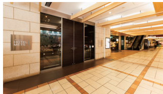
JR立川駅南改札より 徒歩1分

JR立川駅南改札から徒歩1分、駅ビルにもアクセス抜群。ビジネス利用、多摩エリアへのレジャーにも便利な立地が魅力のホテルです。