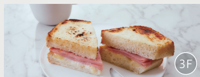
朝食提供店舗「タリーズコーヒー」