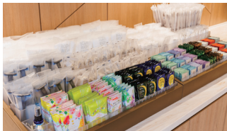
自由には選べるアメニティ

JR立川駅南改札から徒歩1分、駅ビルにもアクセス抜群。ビジネス利用、多摩エリアへのレジャーにも便利な立地が魅力のホテルです。