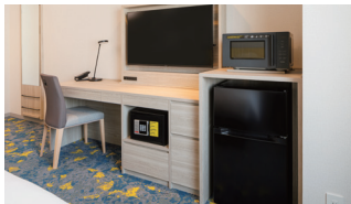
連泊にも適した レジデンシャル style

フロントロビーでお好きなアメニティをお持ちいただけるサービス「アメニティステーション」を設置。スキンケア用品、豊富な入浴剤、カミソリ、ヘアブラシなどをご用意しております。