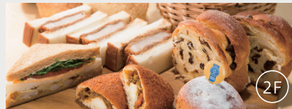
朝食提供店舗「アンテンドウ」