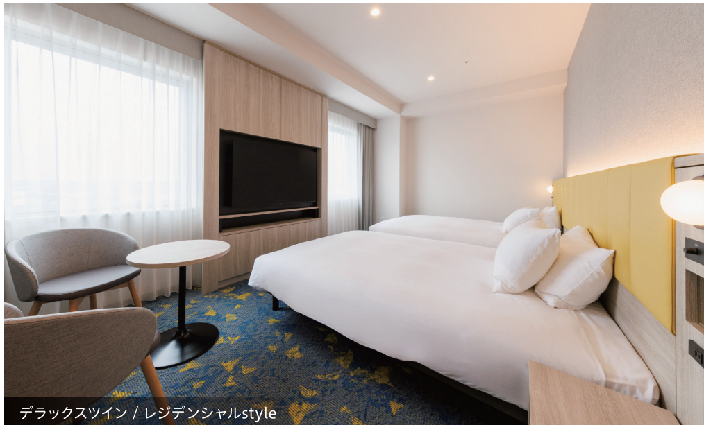
デラックスツイン / レジデンシャルstyle