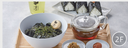
朝食提供店舗「お茶漬 茶 甘味 山本山」