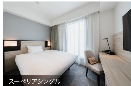
スーペリアシングル