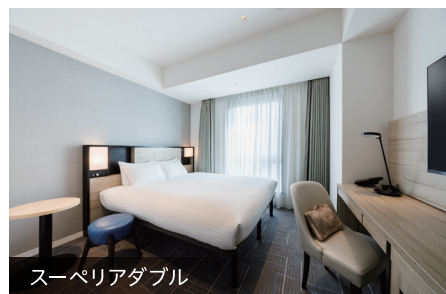
スーペリアダブル